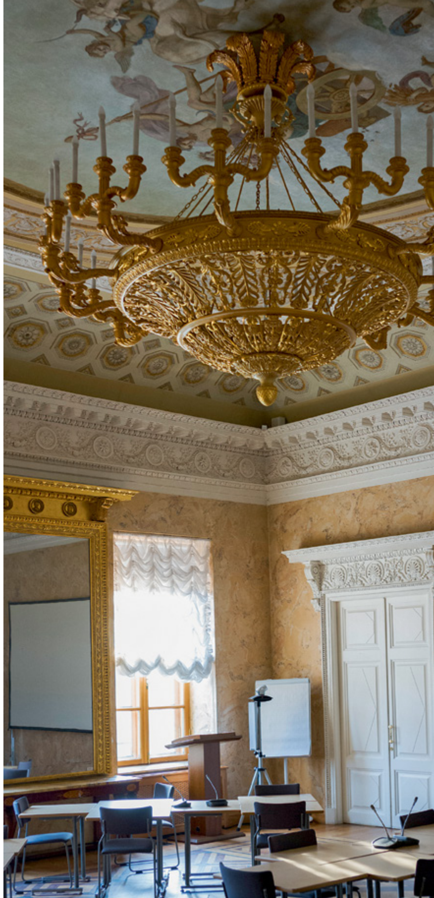
Парадный зал здания в Волховском переулке ВШМ СПбГУ используется преимущественно для проведения официальных мероприятий, например, для заседаний Попечительского совета. Впрочем, часто тут проходят занятия со слушателями бизнес-школы