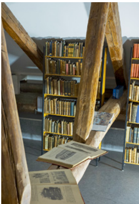
Библиотека Высшей школы менеджмента из обменно-резервного фонда Научной библиотеки имени Максима Горького СПбГУ получила более 2800 экземпляров книг XIX – начала XX века

Сегодня здесь размещается руководство бизнес-школы, дирекции учебных программ, научно-исследовательские центры, библиотека, кафе и прочие службы. В аудиториях проходят обучение по программам магистратуры, аспирантуры, MBA и EMBA.