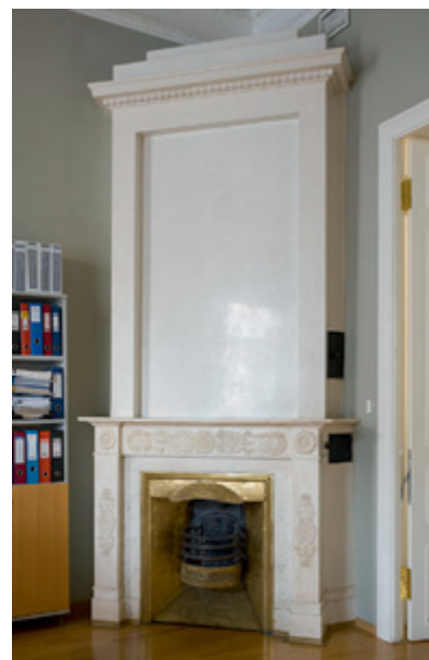
В здании ВШМ СПбГУ сохранились действующие камины