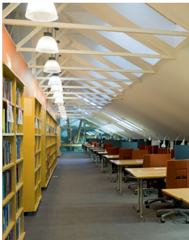
Библиотека ВШМ СПбГУ располагает обширной коллекцией книг на русском и английском языках. Студенты и слушатели имеют доступ к книгам в бумажном и электронном формате