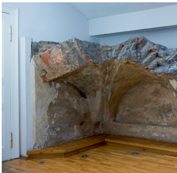
В современном здании можно увидеть фрагмент исторической кладки